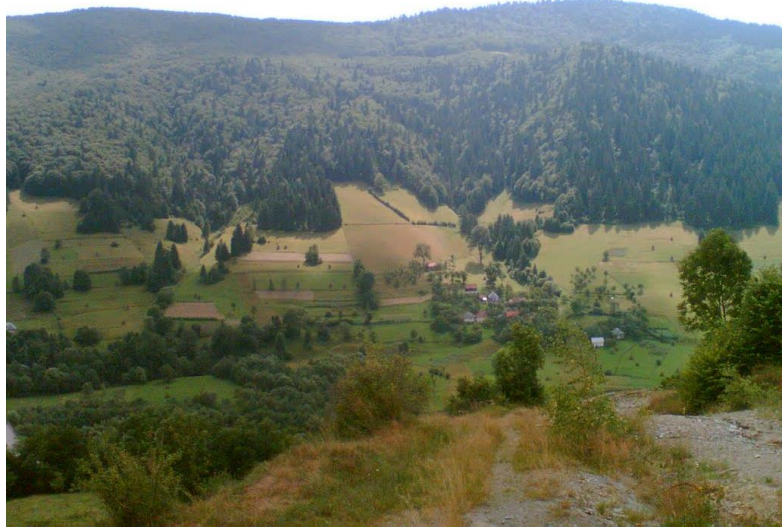
Ponorel in Roemenië